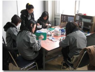
2、按制作标准试生产