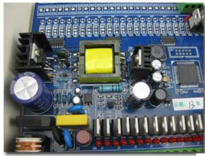
1、工业级高品质组件